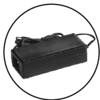
Fuente de Poder