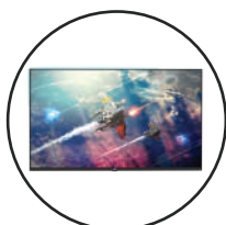
Monitor Plano Odraz