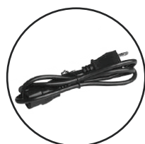
Cable de Energía