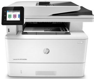
Impresora multifunción HP LaserJet Pro M428fdn

El éxito profesional es sinónimo de una forma de trabajo más inteligente. La impresora multifunción HP LaserJet Pro M428 se ha diseñado para que puedas centrarte más en el crecimiento de tu empresa y situarte un paso por delante de la competencia.