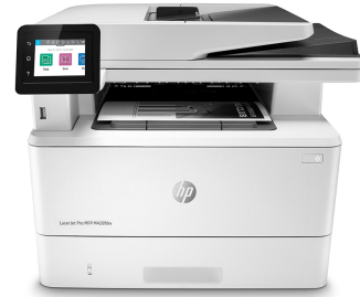
Impresora multifunción HP LaserJet Pro M428fdw

Impresora con seguridad dinámica habilitada. Para ser exclusivamente utilizada con cartuchos que utilicen un chip original de HP. Es posible que no funcionen los cartuchos que no utilicen un chip de HP, y que los que funcionan hoy no funcionen en el futuro. Obtenga más información en: http://www.hp.com/go/learnaboutsupplies